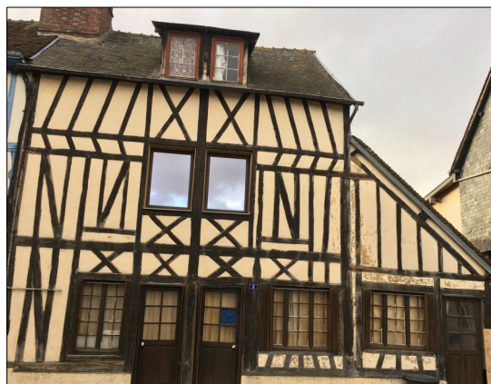
Une maison du centre bourg appelée à revivre !

Voici celui l'exemple d'une adhérente, qui nous paraît édifiant pour notre propos : restaurons, bâtissons, paratgeons, car tel est notre plaisir !