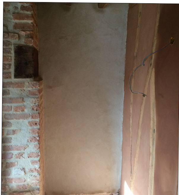
Enduits terre (un ivoire de chez De Wulf et un mélange de havane et rouge tomette de chez St Samson entre les colombages)