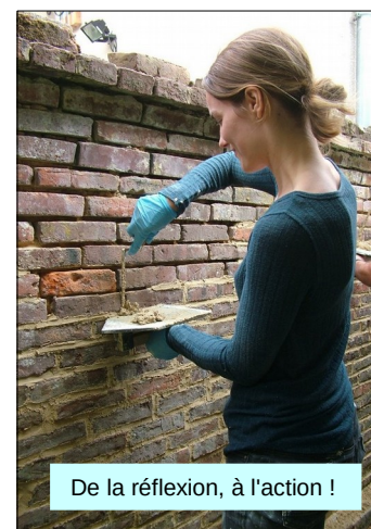
De la réflexion, à l'action !