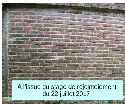
A l'issue du stage de rejointoiement du 22 juillet 2017